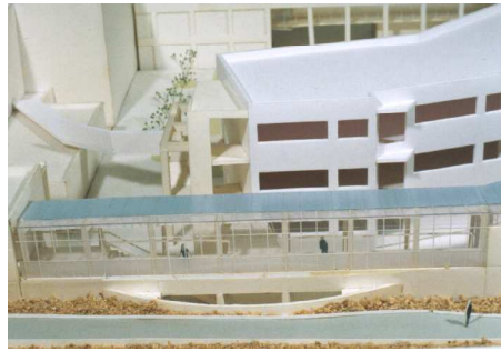
A. 多目的ホールブリッジと既存校舎