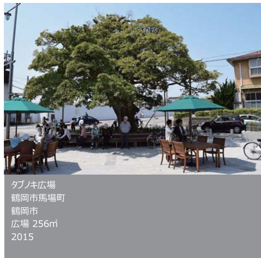
タブノキ広場 鶴岡市馬場町 鶴岡市 広場 256㎡ 2015