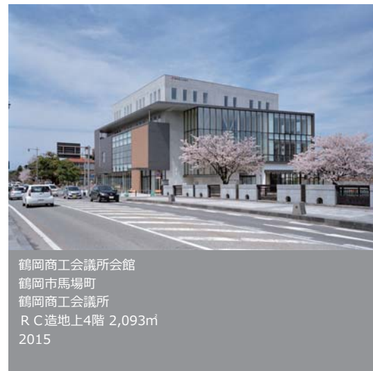
鶴岡商工会議所会館 鶴岡市馬場町 鶴岡商工会議所 R C造地上4階 2,093㎡ 2015