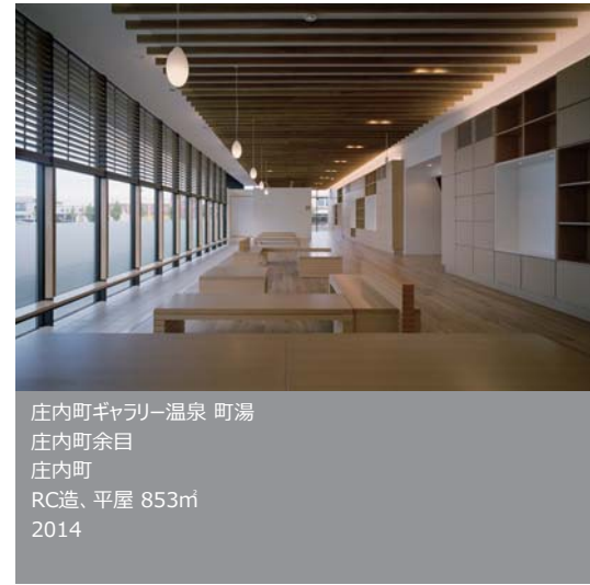
庄内町ギャラリー温泉 町湯 庄内町余目 庄内町 RC造、平屋 853㎡ 2014