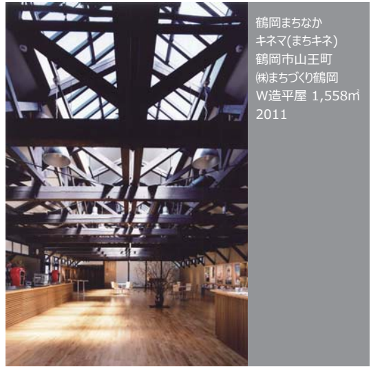
鶴岡まちなか キネマ(まちキネ) 鶴岡市山王町 (株)まちづくり鶴岡 W造平屋 1,558㎡ 2011