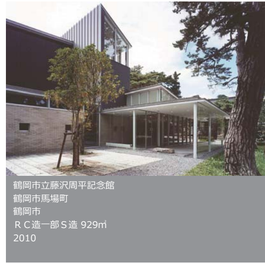
鶴岡市立藤沢周平記念館 鶴岡市馬場町 鶴岡市 R C造一部S造 929㎡ 2010