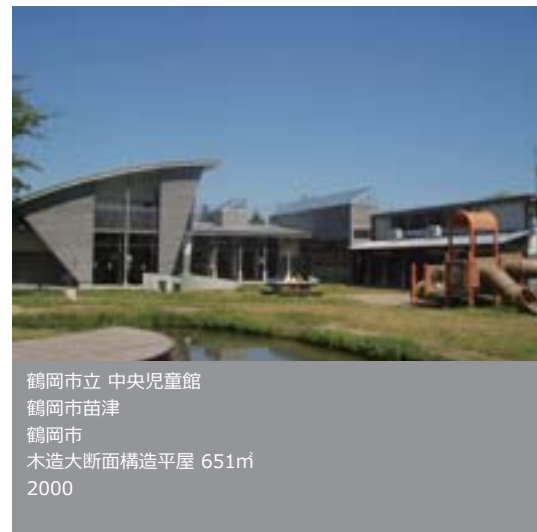
鶴岡市立 中央児童館 鶴岡市苗津 鶴岡市 木造大断面構造平屋 651㎡ 2000