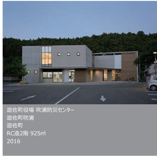
遊佐町役場 吹浦防災センター 遊佐町吹浦 遊佐町 RC造2階 925㎡ 2016