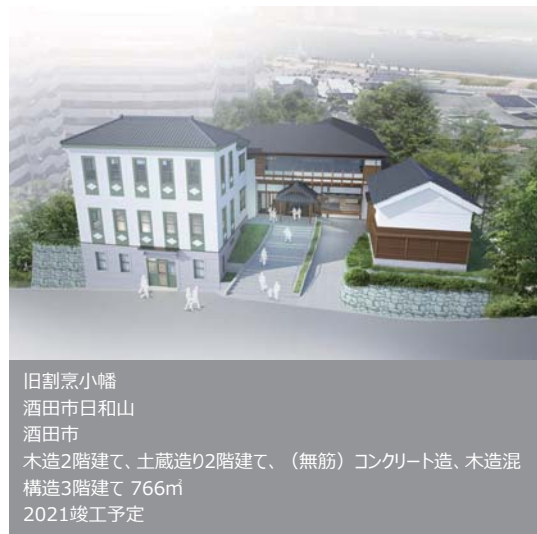
旧割烹小幡 酒田市日和山 酒田市 木造2階建て、土蔵造り2階建て、（無筋）コンクリート造、木造混構造3階建て 766㎡ 2021竣工予定