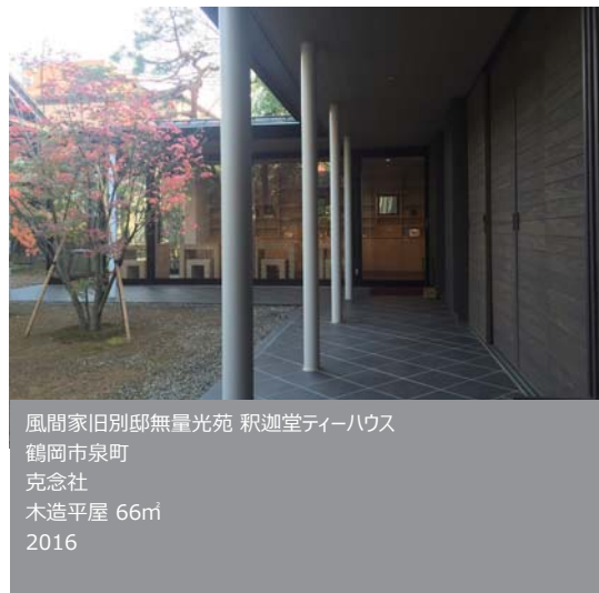
風間家旧別邸無量光苑 釈迦堂ティーハウス 鶴岡市泉町 鶴岡市 克念社 木造平屋 66㎡ 2016