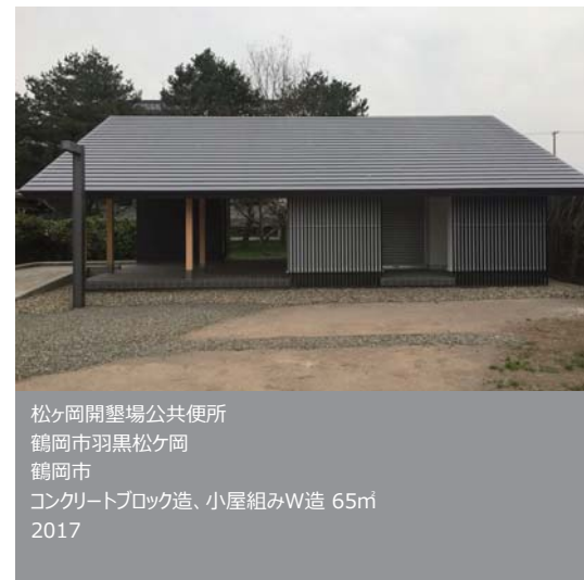
松ヶ岡開墾場公共便所 鶴岡市羽黒松ヶ岡 鶴岡市 コンクリートブロック造、小屋組みW造 65㎡ 2017